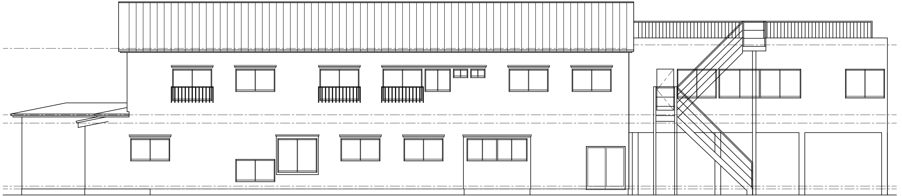
南側立面図 1 / 100